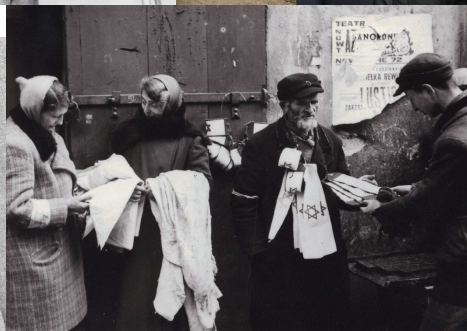
Foto di vittime e carnefici della Shoah