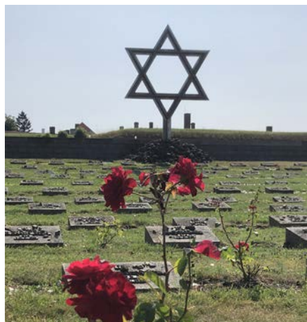
Il cimitero degli ebrei nel campo-ghetto di Terezín

Nell'anno scolastico 2025–2026, in autunno, un gruppo di circa 50 studenti e studentesse che hanno frequentato il seminario con le sue attività, parteciperà ad un viaggio di tre/quattro giorni in Repubblica Ceca.