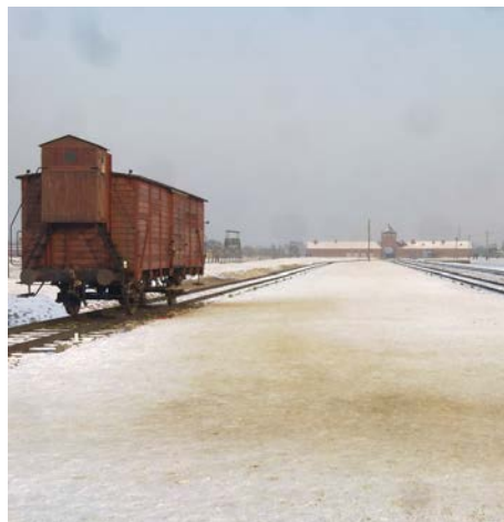
Il binario del campo di Auschwitz-Birkenau

Cerimonia di deposizione di una corona di alloro al monumento dedicato alle vittime dei lager nazisti e di tutte le prigioni, alla presenza delle autorità civili e militari, dei rappresentanti delle associazioni combattentistiche e d'arma e di una delegazione studentesca