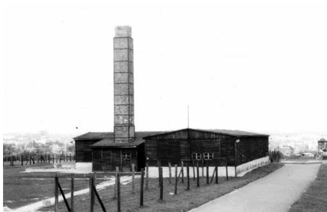
Crematorio del campo di Majdanek. Polonia, dopo il 24/07/1944, Mémorial de la Shoah

Varsavia e Lublino-Majdanek , date da definire a ottobre 2019